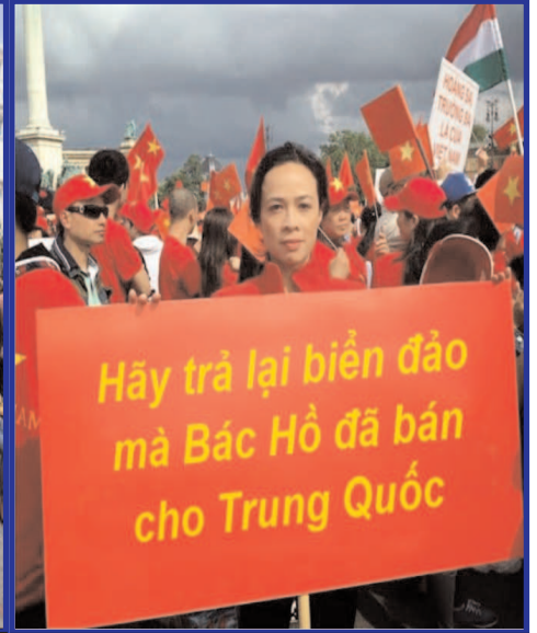
Budapest 19-5-2014 Du sinh biểu tình Toà Đại sứ Việt Cộng tổ chức