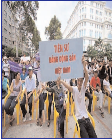
Dân Sài Gòn biểu tình